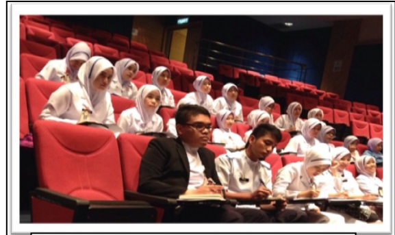
Taklimat EKSA bagi kakitangan baru 27/1/2015

Focus Training kepada ketua zon telah dijalankan pada 4/3/15. Seramai 32 orang ketua zon telah menghadiri latihan ini. Focus Training ini memberi penekanan kepada kelemahan-kelemahan yang dilaporkan hasil dari audit yang telah dijalankan. Analisa pencapaian serta kelemahan –kelemahan yang telah dikenalpasti hasil dari audit yang lepas turut dibincangkan serta langkah penambahbaikan telah dikenal pasti untuk dijalankan di zon masing-masing.