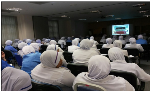
CNE KEJURURAWATAN 10hb FEBRUARI 2015

Selain daripada itu terdapat juga taklimat EKSA diberi kepada kakitangan yang baru bertugas di HoSHAS. Sebanyak 2 sesi taklimat dijalankan pada 27/1/2015 dan 11/3/2015 dimana ianya dihadiri oleh seramai 77 orang kakitangan baru. Taklimat EKSA turut dijalankan kepada Pegawai Perubatan Siswazah dalam dalam memberikan kefahaman tentang EKSA. Seramai 14 orang orang telah terlibat di dalam taklimat ini yang telah dijalankan pada 3/3/2015.