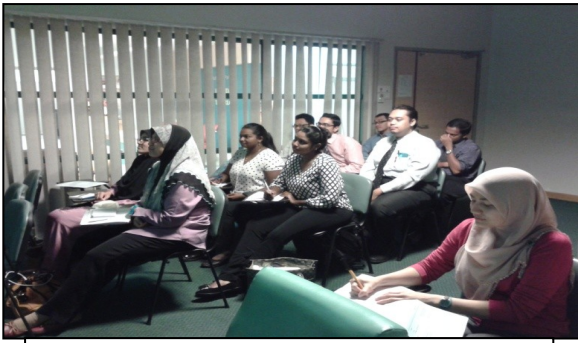
Taklimat EKSA bagi HO 3/3/2015