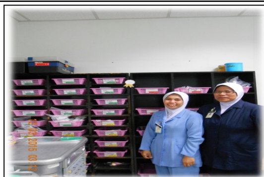
Zon Kenanga 11&12 – Bilik Utiliti Bersih 2 sticker Good Job