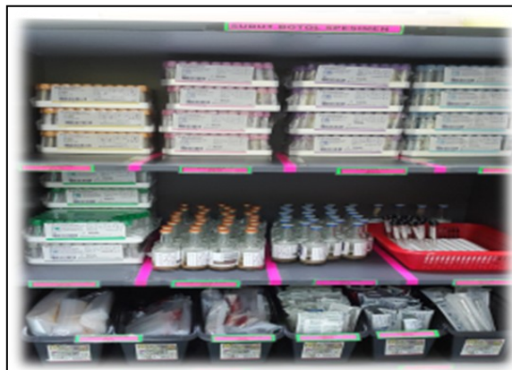
Zon Kenanga 14- Bilik Utiliti Bersih 1 sticker Good Job