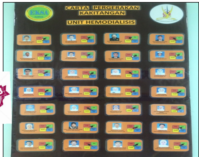
Zon Hemodialisis –Zon Go Green dan Carta pergerakan kakitangan 2 sticker Good Job