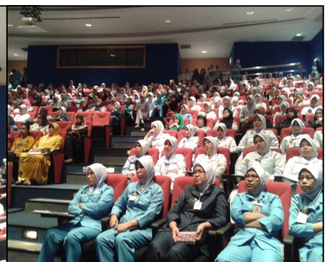
CME 6hb MAC 2015