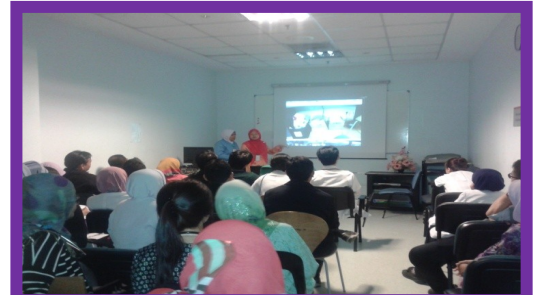
JAB. KECEMASAN 26hb FEBRUARI 2015

Terdapat 5 kali Taklimat EKSA telah diberi kepada kakitangan HoSHAS. Sesi taklimat EKSA oleh Jawatankuasa Latihan ini telah diberi kepada warga kerja Klinik Pakar, Kejururawatan, Jabatan Kecemasan dan Trauma, Rehabilitasi serta sesi CME kepada semua warga kerja HoSHAS. Seramai 883 orang kakitangan telah menghadiri taklimat yang dijalankan.