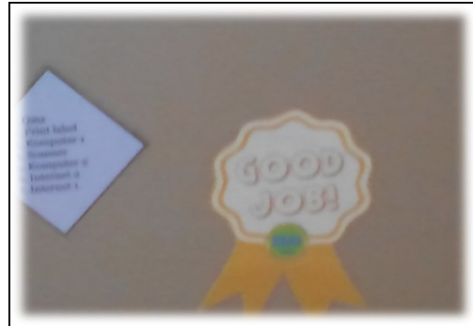
Zon Klinik Pakar-Klinik Paediatrik 1 sticker Good Job